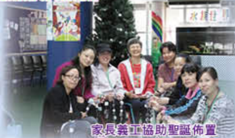
家長義工協助聖誕佈置 Christmas decorations by the parent volunteers