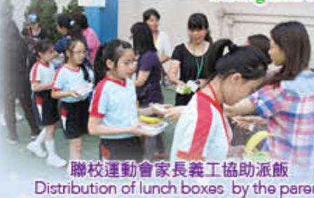
聯校運動會家長義工協助派飯 Distribution of lunch boxes by the parent volunteers on joint-school Sports Day

凝聚家長，強化力量 Strengthen the cohesion of parents