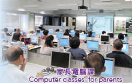
家長電腦課 Computer classes for parents