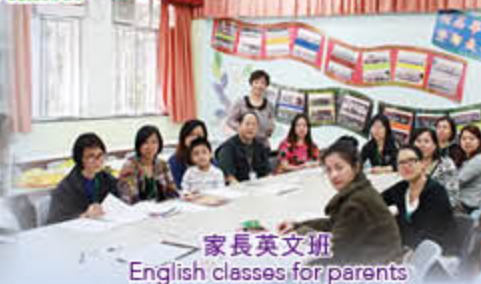
家長英文班 English classes for parents

凝聚家長，強化力量 Strengthen the cohesion of parents