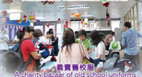
義賣舊校服 A charity bazaar of old school uniforms

緊密家校關係，促進學生成長 Close home-school relationship contributes to students' growth