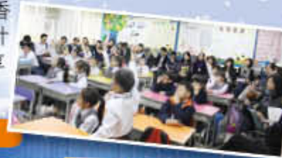
小班教學培訓學員基地，各校老師觀課

在學與教方面，本校是持續深化小班化教學，以提升學與教的成效。各科都在學與教原有的基礎上，不斷優化學生的學習。因此，本校繼 2008 年 9 月被香港教育學院邀請成為香港首三間「小班教學」先導計劃學校後，由 2009 年 9 月起，本校亦被香港教育學院邀請成為「小班教學領導協作計劃」的核心成員。主力負責向其他學校分享本校如何推展「小班教學」的計劃及心得。