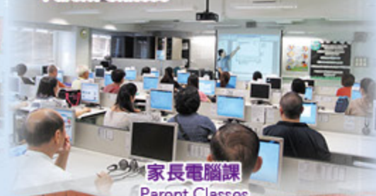
家長電腦課 Parent Classes

緊密家校關係，促進定學生成長 Close home-school relationship contributes to students' growth