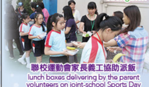
聯校運動會家長義工協助派飯 lunch boxes delivering by the parent volunteers on joint-school Sports Day

凝聚家長力量，強化家長效能 strengthen the cohesion of parents