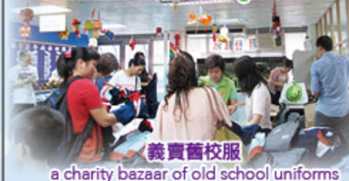
義賣舊校服 a charity bazaar of old school uniforms

緊密家校關係，促進定學生成長 Close home-school relationship contributes to students' growth