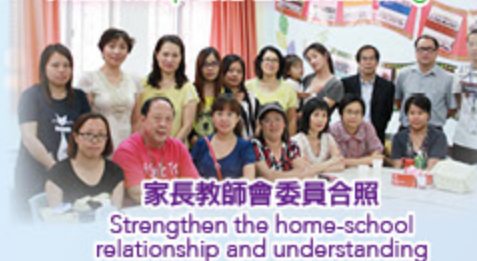
家長教師會委員合照 Strengthen the home-school relationship and understanding

加強家校聯繫，增加彼此溝通 Strengthen the home-school relationship and understanding