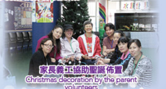
家長義工協助聖誕佈置 Christmas decoration by the parent volunteers