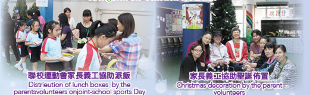
聯校運動會家長義工協助派飯 Distribution of lunch boxes by the parents volunteers on joint-school sports Day

凝聚家長，強化力量 Strengthen the Cohesion of Parents