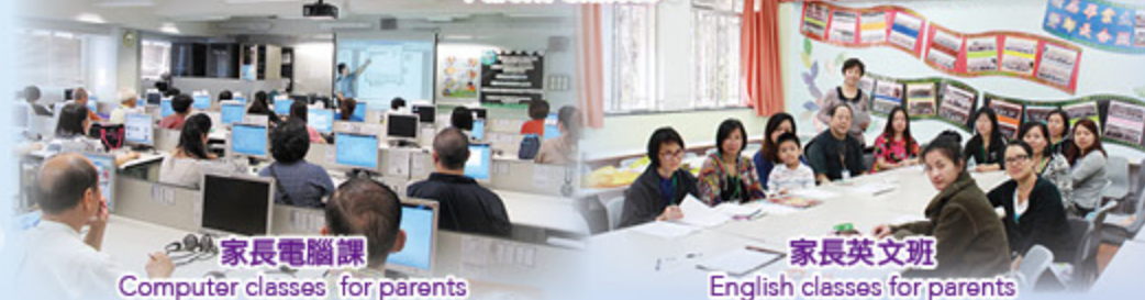
家長電腦課 Computer classes for parents