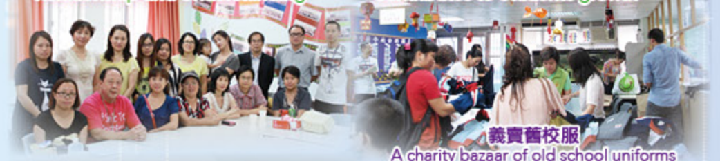
義賣舊校服 A charity bazaar of old school uniforms

緊密家校關係，促進學生成長 Close Home-school Relationship Contributes to Students' growth