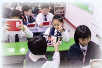
全校鋪設光纖，優化學習