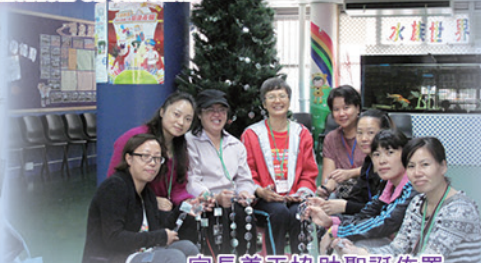
家長義工協助聖誕佈置 Christmas decorations by the parent volunteers