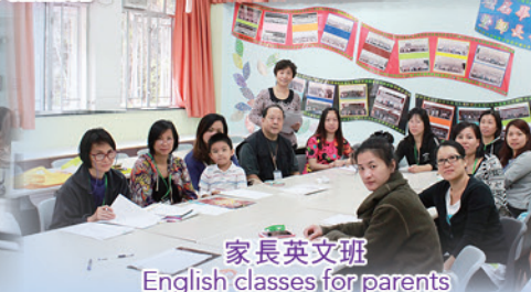
家長英文班 English classes for parents

凝聚家長，強化力量 Strengthen the cohesion of parents