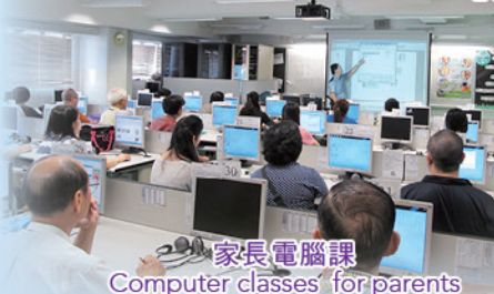
家長電腦課 Computer classes for parents