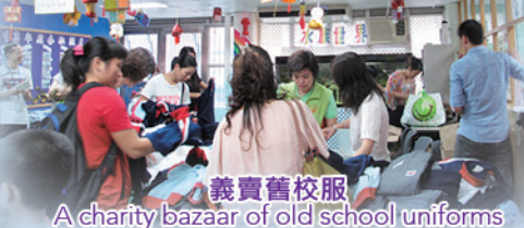
義賣舊校服 A charity bazaar of old school uniforms

緊密家校關係，促進學生成長 Close home-school relationship contributes to students' growth