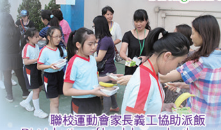
聯校運動會家長義工協助派飯 Distribution of lunch boxes by the parent volunteers on joint-school Sports Day

凝聚家長，強化力量 Strengthen the cohesion of parents