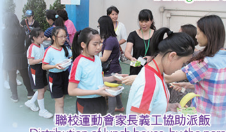
聯校運動會家長義工協助派飯 Distribution of lunch boxes by the parent volunteers on joint-school Sports Day

凝聚家長，強化力量 Strengthen the cohesion of parents