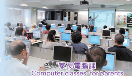
家長電腦課 Computer classes for parents