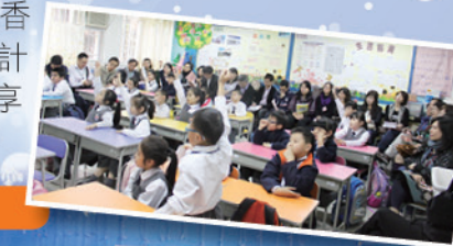
小班教學培訓學員基地，各校老師觀課

在學與教方面，本校是持續深化小班化教學，以提升學與教的成效。各科都在學與教原有的基礎上，不斷優化學生的學習。因此，本校繼 2008 年 9 月被香港教育學院邀請成為香港首三間「小班教學」先導計劃學校後，由 2009 年 9 月起，本校亦被香港教育學院邀請成為「小班教學領導協作計劃」的核心成員。主力負責向其他學校分享本校如何推展「小班教學」的計劃及心得。