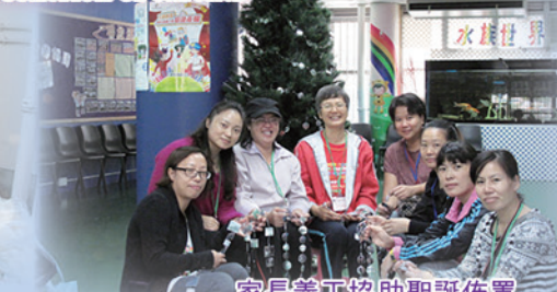
家長義工協助聖誕佈置 Christmas decorations by the parent volunteers