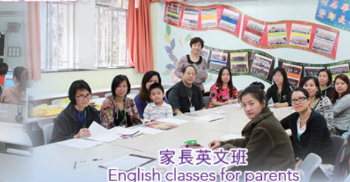
家長英文班 English classes for parents

凝聚家長，強化力量 Strengthen the cohesion of parents