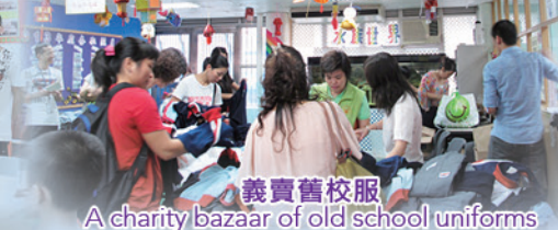
義賣舊校服 A charity bazaar of old school uniforms

緊密家校關係，促進學生成長 Close home-school relationship contributes to students' growth